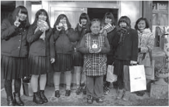
(配布にご協力いただいた五泉高校生の皆様)

五泉高校の皆様からは、心温まるお手紙を書いていただき、「安心袋」と一緒にお届けしました。