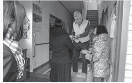
(高校生が作成した小物も一緒にお届けしました)