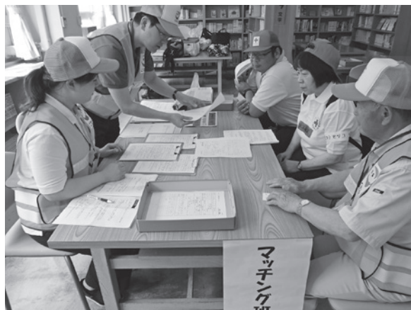
災害ボランティアセンターの設置運営訓練 (ボランティアに活動紹介をしている様子です)