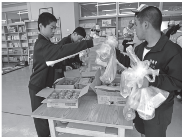
支援物資の仕分けを想定した訓練 (川東中学校の中学生も参加してくれました)

今回の訓練によって、被災者、ボランティア、災害ボランティアセンターの連携の方法を学ぶことができました。